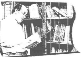
SYED HAMID ALBANI dengan buku-buku kesukaannya

W ALAUOH sudah menjadi seorang menteri. Datu Syed Hamid akan tetap berkecuali. Beliau tidak pernah mengangap dirinya sebagai menteri yang suka dikritik. Beliau adalah seorang yang suka dikritik. Beliau adalah seorang yang suka dikritik.