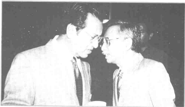
Berlaga cermin mata, Mahathir dan rakan karibnya Daim: "Tun, berapa persen dapat ...." Daim dikatakan pernah bergaduh dengan Anwar, tapi kini sokong 101 peratus. Bagaimanapun Mahathir begitu percayakannya.