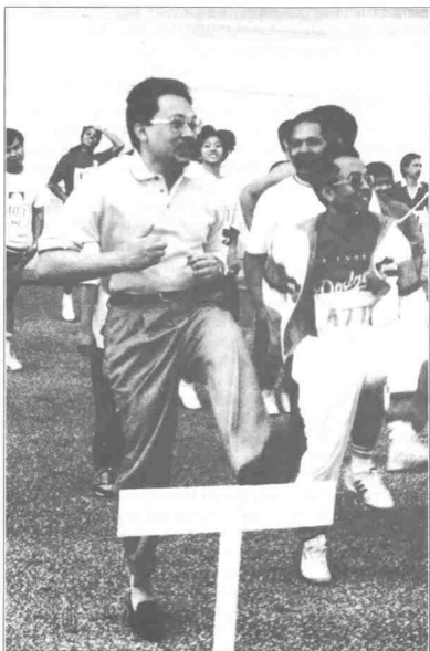
Anwar, anak muda yang tampan dan kakak, begitu hebat berlatih. Natiuhnya, teruk Ghafar diperlakukannya. Selepas Ghafar, siapa lagi? Mungkinkah Mahathir?