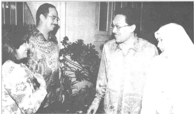
Mesra sekali Anwar dan isteri Najib. Mungkinkah Najib akan Anwar pilih sebagai orang no. 2 bila Mahathir berundur nanti? Anwar tentunya beringat, Najib bukan calang-calang orang. Najib sudah bina empayarnya sendiri.